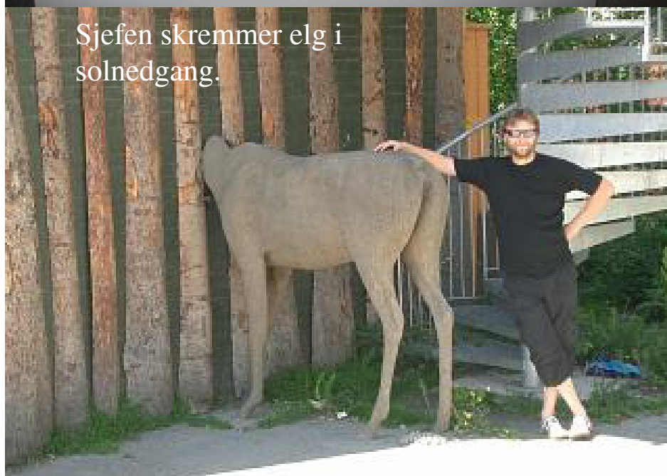
Sjefen skremmer elg i solnedgang.