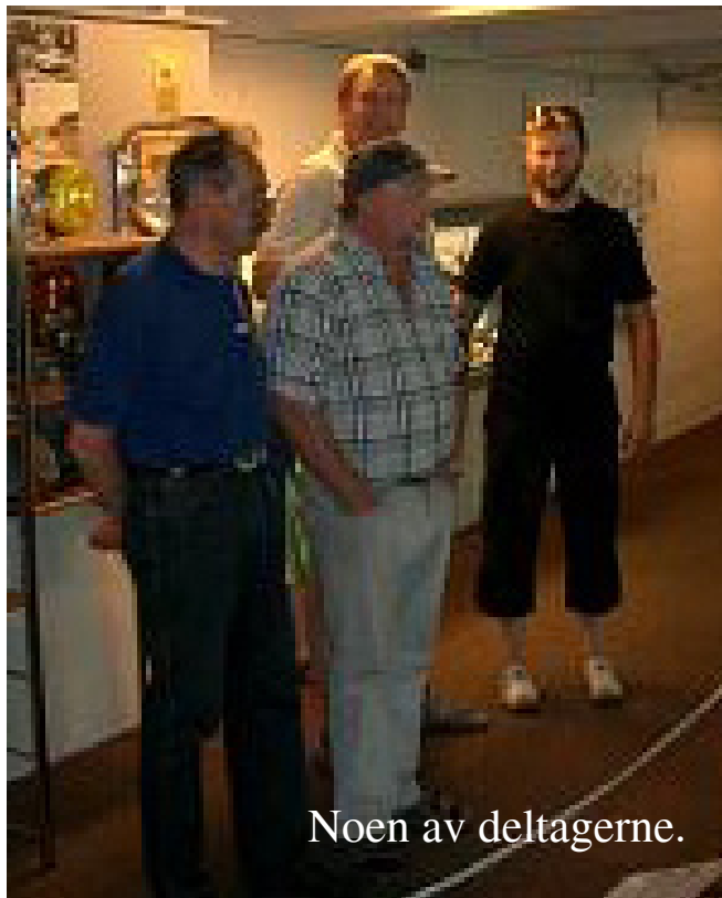
Noen av deltagerne.