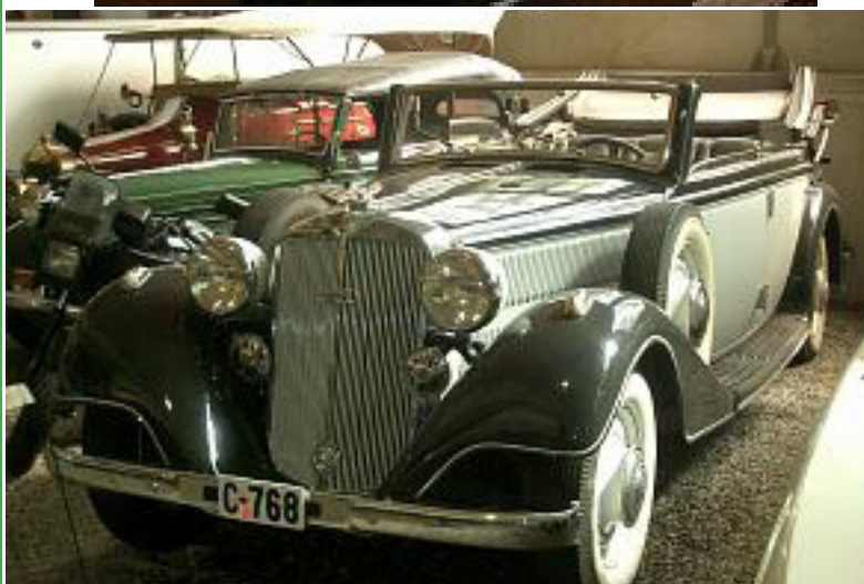
Gutta på tur.